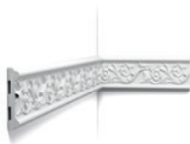
Listwy ścienne (ozdobne i duże)